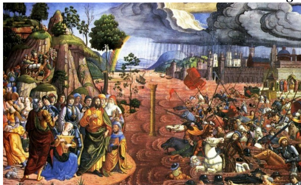
Passaggio del Mar Rosso, Biagio di Antonio

La comunità monastica dell'Eremo San Giorgio